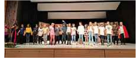
Einschulung Klasse 4b