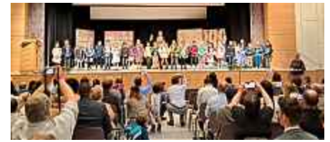
Einschulung Klasse 1a

Schulwoche unsere neuen Fünftklässler und unsere neuen Erstklässler begrüßt.