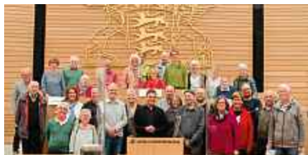
Die Besuchergruppe aus dem Kreis Böblingen im neu gestalteten Plenarsaal.

Genug Gesprächsstoff auch für die Abschlussrunde bei Kaffee und Kuchen.