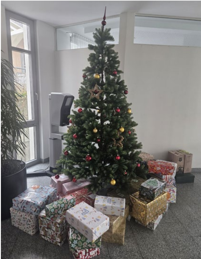
Weihnachtsbaum im Foyer des Rathauses

In diesem Jahr wurde zum 7. Mal die Weihnachtsaktion Wunschbaum durchgeführt. Insgesamt gingen Wunschzettel von 13 Kindern bei der Gemeindeverwaltung ein. Diese wurden auf Sterne übertragen und an den Wunschbaum gehängt.