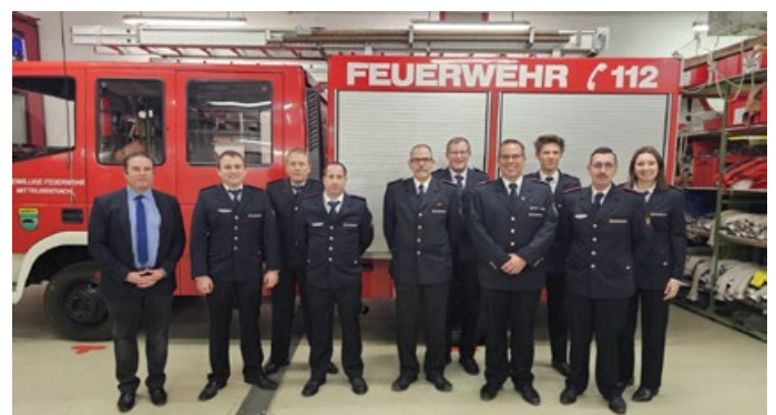
Gesamtausschuss der Feuerwehr Mittelbiberach