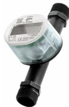
Wasserzähler, Netze BW GmbH