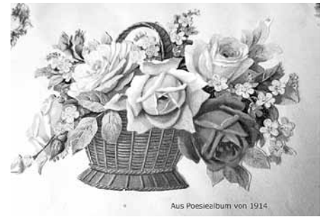
Aus Poesiealbum von 1914.

zeit; ich bin gespannt, wie unsere Kinder und Enkel ihre "Erinnerungen" heute für die Nachwelt bewahren werden.