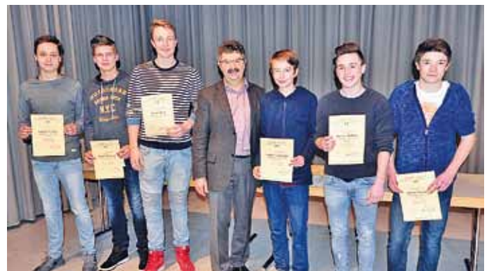
SVM – Abt. Tennis (Junioren):