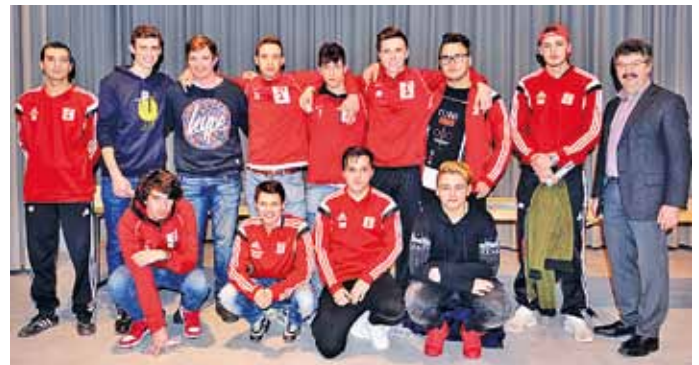
SVM – Abt. Fußball (B-Junioren):