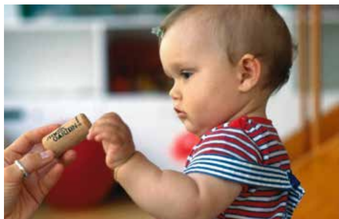
Babygrei.tif (Inst.für elementare Musikpädagogik – ifem)

Informationen erhalten Sie bei der Musikschule der Stadt Ehingen, Spitalstraße 30, 89584 Ehingen, Telefon 07391 503-521, E-Mail musikschule@ehingen.de .