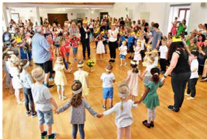
Eindrücke aus der Musikalischen Früherziehung und der BeWEGenden Musik beim Musikschultag.

Anmeldungen sind online auf der Homepage unter www.musikschule-ehingen.de möglich. Weitere Informationen erhalten Sie bei der Musikschule der Stadt Ehingen, Spitalstraße 30, 89584 Ehingen, Telefon 07391 503-521, E-Mail musikschule@ehingen.de .