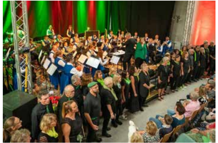
fEinklang und Stadtkapelle Blaubeuren mit Solosängerin.

Reinhard Höser Pressewart Liederkrantz Kirchen e.V.