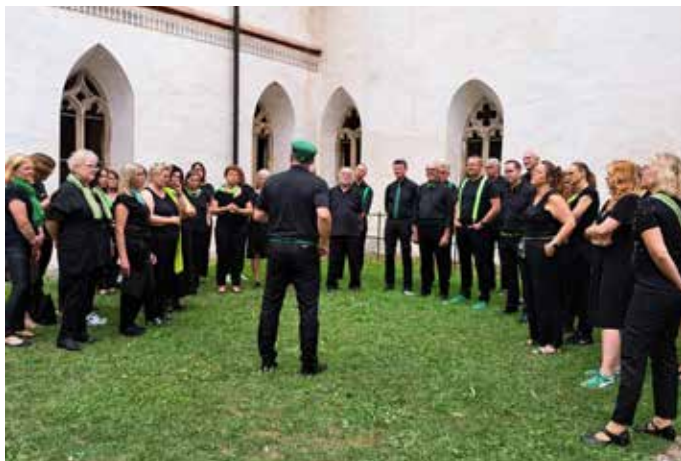
fEinklang beim Einsingen im Kreuzgang vom Kloster.