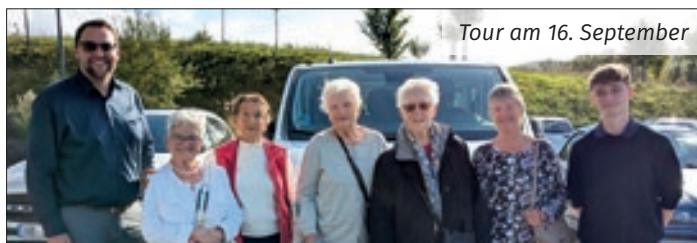
Tour am 16. September