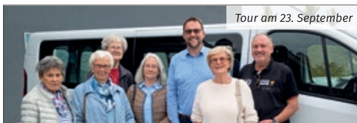
Tour am 23. September