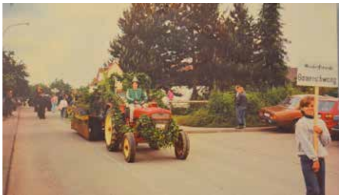
Festwagen der Wanderfreunde.