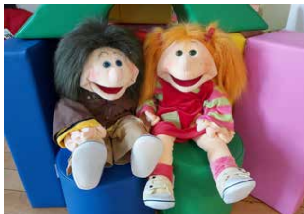
Das Bürgerhaus Oberschaffnei bietet ein offenes Spielzimmer, das Kinder zum freien Spielen einlädt.

Das Bürgerhaus Oberschaffnei ist auch für die kleinsten Ehingerinnen und Ehinger offen. Für einige Angebote kooperiert die Lokale Agenda dabei mit den Frühen Hilfen der Caritas Ulm-Alb-Donau: