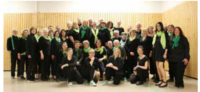
fEinklang beim Probenwochenende im März.