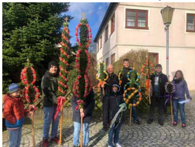
Die Palmträger nach dem Gottesdienst.