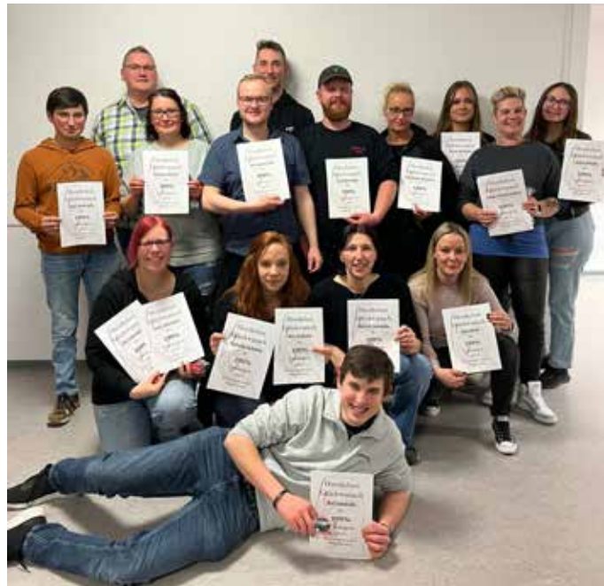
Die Mitglieder der NZ Gamerschwang.

Nach der Fasnet ist vor der Fasnet, wir freuen uns auf eine großartige Saison 2025.