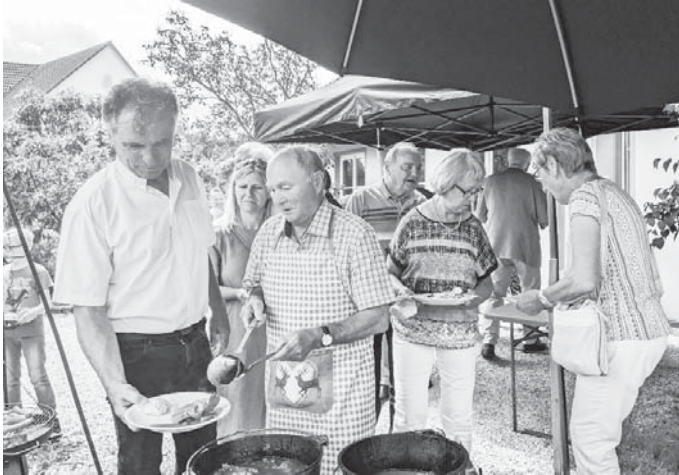
Frisch vom Grilltopf auf den Teller, lecker !