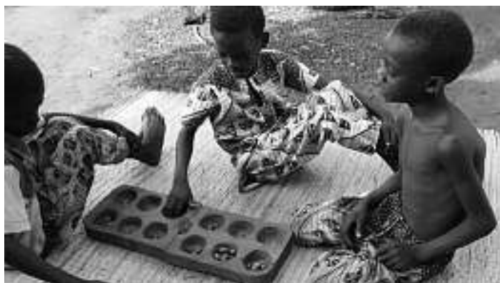
Die Kinder in Benin danken es Ihnen!!!

Wer also nochmals zugreifen möchte, um sich Bücher oder Spiele zu holen, sollte am Wochenende vorbeikommen, der Rest wird dann an eine gemeinnützige Organisation verschenkt. In diesem Zusammenhang möchten wir jedoch auch allen Mitbürgern danken, die uns mit Ihren Bücher- und Geldspenden in dieser "veranstaltungslosen Corona-Zeit" so großartig unterstützt haben.