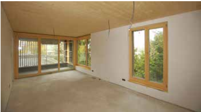
Innenansicht einer Neubauwohnung.