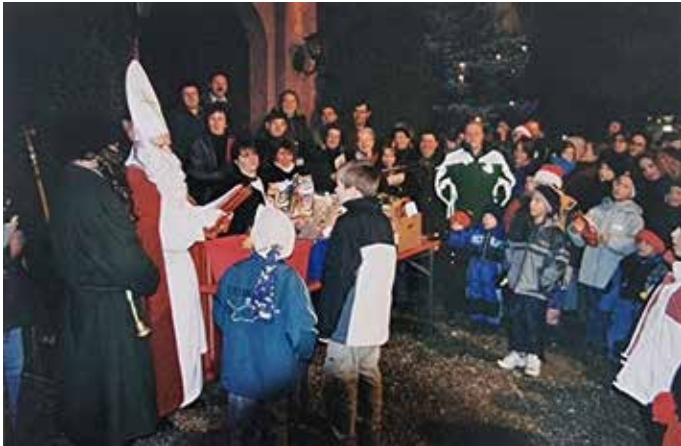
Die erste Nikolausfeier der Wanderfreunde vor dem Gamerschwanger Schloß.

Die Nikolausfeier der Wanderfreunde hat eine lange Tradition, diese wollen wir weiterhin aufrecht erhalten.