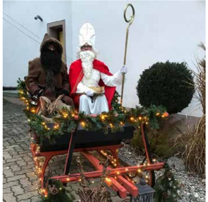
Auch in diesem Jahr besucht der Nikolaus Kirchen und seine Teilorte.

Wir geben diese aber komplett an einen gemeinnützigen Verein weiter.