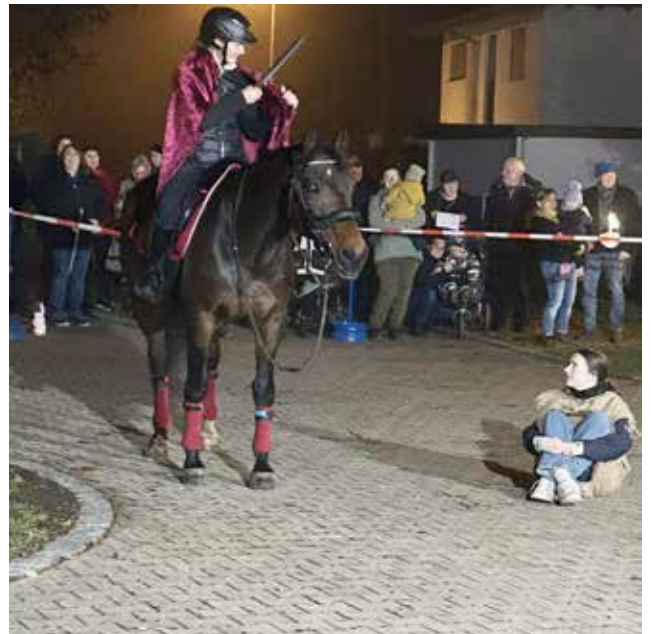
St. Martin teilt seinen mantel.