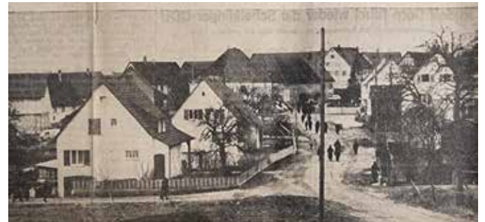
Blick auf die heutige alte Bundesstrasse.

Zielbewusst und eigenständig, Gamerschwang ist eine kleine, aber lebendige Landgemeinde. So titelte das Ehinger Tagblatt am 26. März 1965 in der Rubrik: Unsere dörfliche Heimat.