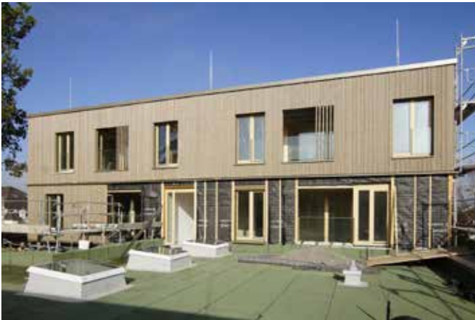
Neue Wohnanlage in der Hehlestraße.

Für 2025 ist die Gestaltung der Freianlage am Neubau und abschließend die Umgestaltung der Freianlage am Bestandsgebäude geplant. Die Baukosten belaufen sich auf rund 14 Millionen Euro.