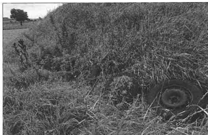
Rechtswidrige Autoreifenablagerung im Gewann Damertsäcker