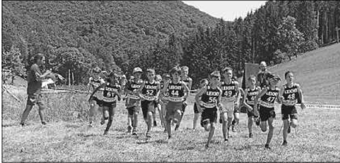
Crosslauf vor 2 Jahren

Um 12.30 Uhr beginnt das Spezialspringen auf der K20-Schanze, der Crosslauf startet voraussichtlich um 15:00 Uhr.