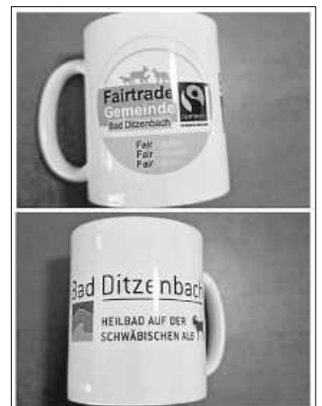
Neue Kaffeebecher mit Fairtrade-town Logo

Schluss mit Kaffee, dem alles latte ist! Du hast jeden Tag die Wahl, ob du deinen Teil zu einer nachhaltigeren und sozialeren Welt beiträgst. Klingt anstrengend? Ist aber ganz leicht. Und geht besonders gut beim Kaffeetrinken. Wenn der Kaffee fair gehandelt ist. Faire Preise für Kleinbauern und ökologischer Anbau sind hier inklusive. Das schmeckst du in jeder Tasse. Egal war gestern. Entscheide dich für mehr globale Gerechtigkeit UND das bessere Aroma!