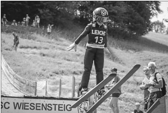
Sprung von der K20-Schanze