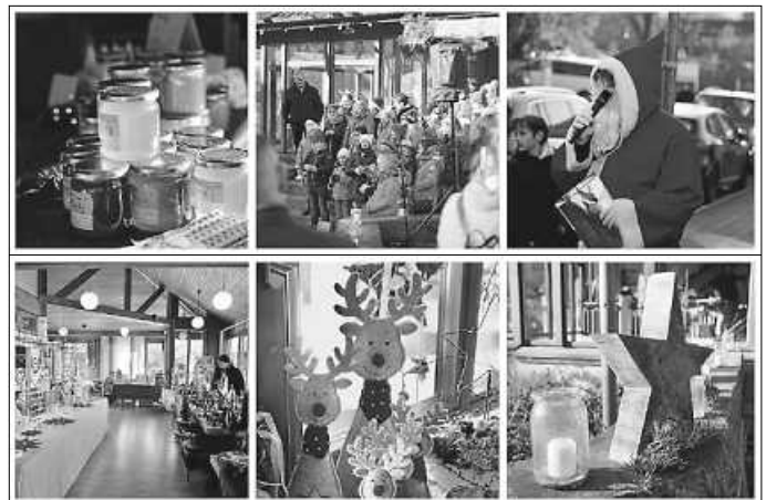
Rückblick Weihnachtsmarkt 2024

Liebe Mitbürgerinnen und Mitbürger, liebe Standbetreiberinnen und Standbetreiber, mit großem Bedauern müssen wir Ihnen mitteilen, dass das für den 29. November 2025 geplante Bad Ditzzenbacher Adventsdorfle auf dem Platz vor der Alten Dorfkirche nicht stattfinden kann . Aufgrund der aktuell sehr angespannten Haushaltslage der Gemeinde war diese Entscheidung leider unumgänglich – und musste kurzfristig getroffen werden. Uns ist bewusst, dass dies für viele enttäuschend ist, insbesondere für diejenigen, die sich bereits angemeldet und mit viel Vorfreude vorbereitet haben. Dafür möchten wir uns herzlich bedanken und zugleich um Verständnis bitten. Wir kehren in diesem Jahr zurück zum kleineren, traditionellen Weihnachtsmarkt im Haus des Gastes , der in gewohnt gemütlicher Atmosphäre am Samstag, dem 29. November 2025, von 11 bis 18 Uhr, stattfinden wird . Alle, die sich bereits für das Adventsdorfle angemeldet haben, wurden von uns in den letzten Tagen persönlich kontaktiert, um abzuklären, ob sie auch am kleineren Markt teilnehmen möchten. Wir hoffen, dass wir trotz der veränderten Rahmenbedingungen gemeinsam eine schöne, stimmungsvolle Adventszeit erleben können – wenn auch in kleinerem Rahmen.