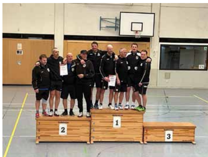
Die glücklichen Gewinner

Mehr Sicherheit für alle. Dank „Tempo 30“