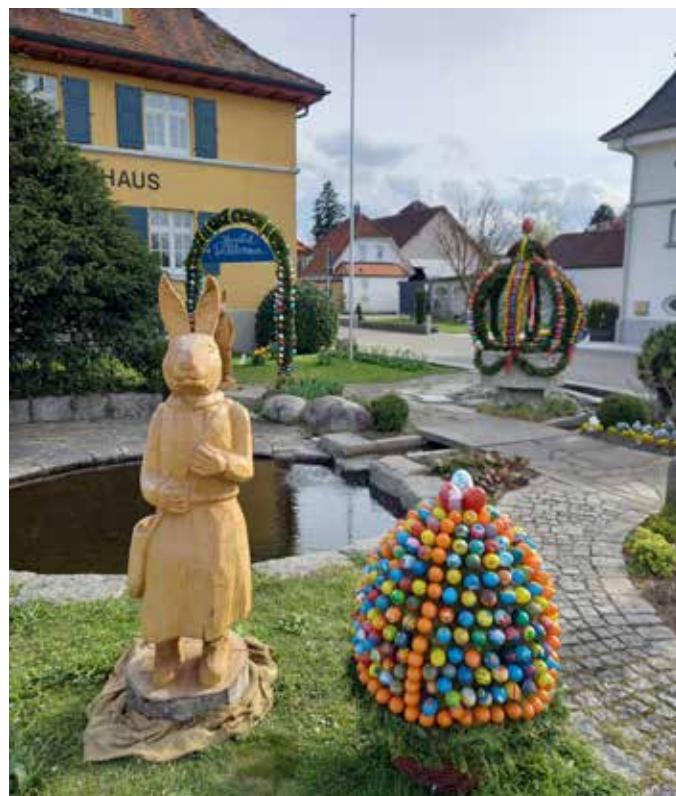
Die schöne Osterdekoration rund um den Brunnen beim Rathaus.