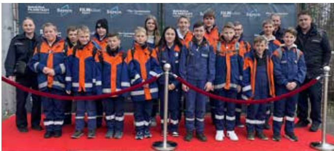
Die Rißtisser Jugendfeuerwehr