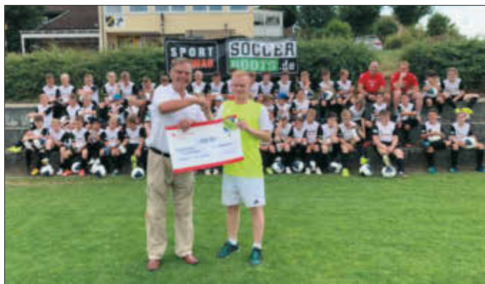
Unterstützt wurde mit einer Förderung der LEADER Jagstregion u. a. das Fußballcamp von Jugendlichen für Kinder in Rainau.