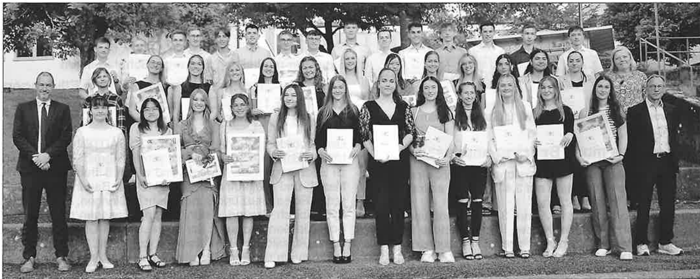
Abiturientinnen und Abiturienten des Ostalb-Gymnasiums Bopfingen