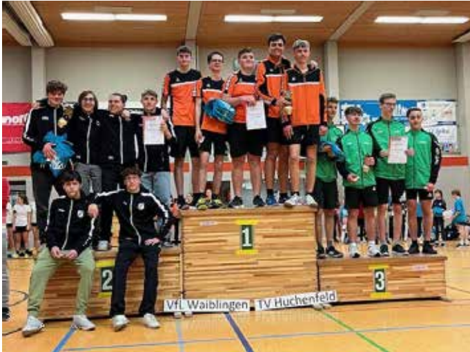
Männliche Jugend 15-18