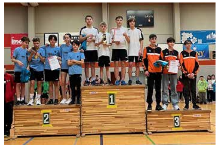
Männliche Jugend 11-14