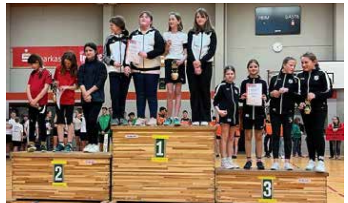
Weibliche Jugend 11-14