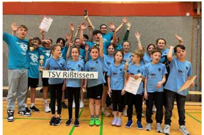
Die erfolgreichen Teilnehmer