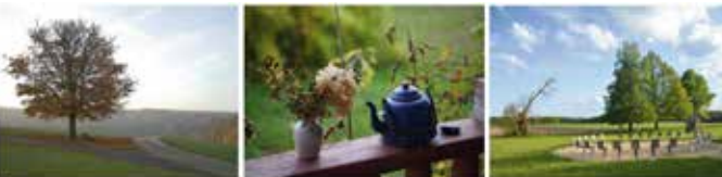
„Kastanienbaum“ beim alten Musikerhäusle.