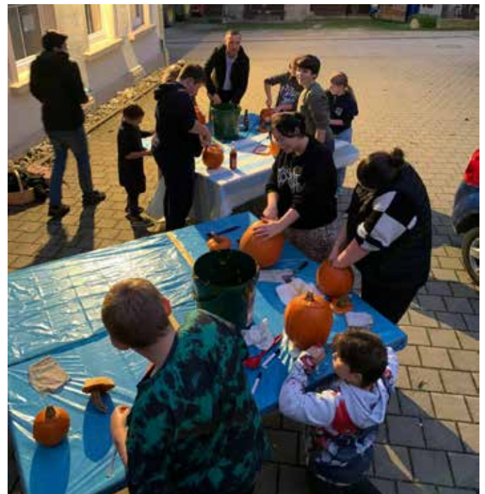
Jugendtreff Kürbis schnitzen.

Beim Jugendtreff im Dorfgemeinschaftshaus stand dieses mal das Kürbis schnitzen für Halloween auf dem Programm. Die Jugendlichen hatten viel Spaß und jeder freut sich auf Halloween, um seinen selbst geschnittenen Kürbis zu präsentieren.