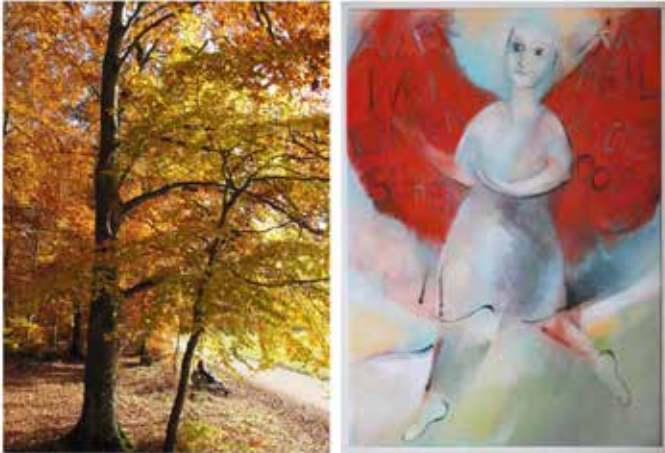
„Herbstwald“ Foto: Gerhard Beck (C).

Wir danken insbesondere den Fotografen Gerhad Beck, Banne Geiselhart und Hannes Häfele für die Druckgenehmigung ihrer Fotos.