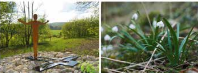
„Segenskreuz“ des Lebenshorizontewegs des Künstlers Martin Burchard, Foto: Banne Geiselhart (C).