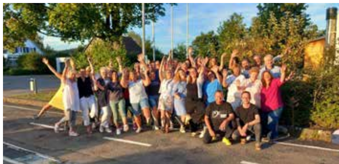
Chor fEinklang vor Proben für Weinfest und Chorfestival.

Für alle Freunde der Chormusik eine tolle Gelegenheit, fünf verschiedene Chöre zu hören und zu sehen, zumal der Eintritt frei ist.