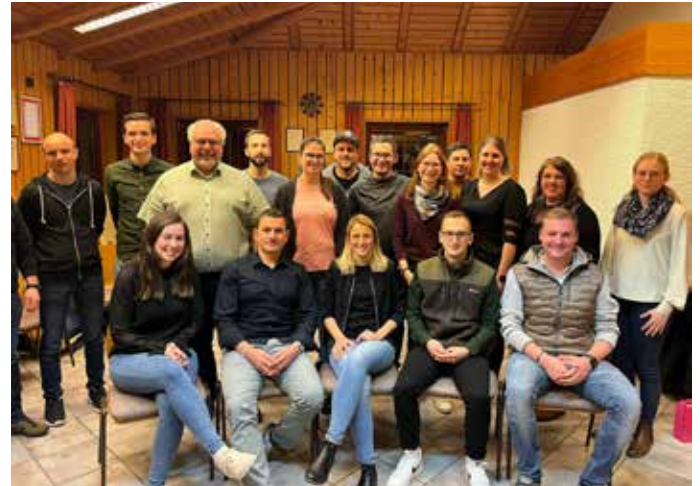
Die neu besetzte Gesamtvorstandschaft des Musikvereins Mundingen