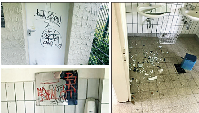
Das „mutige“ Werk von „echten Helden“

Wir sind nicht gewillt, dieses „Spielchen“ unbegrenzt mitzumachen. Deshalb klare Ansage: Wenn sich so etwas noch ein weiteres Mal wiederholt, wird die Toilette wieder geschlossen! Es wäre zwar für die Bürgerinnen und Bürger, die froh über diese Möglichkeit sind und die Toilette „normal“ nutzen, sehr schade, dass wegen ein paar wenigen Idioten keine öffentliche Toilette mehr zur Verfügung gestellt werden kann. Aber das ist leider wohl ein grundsätzliches Problem unserer Gesellschaft: Einigen wenigen sind Vorgaben, die das Zusammenleben regeln, vollkommen egal und die ganz überwiegende Mehrheit muss darunter leiden. Eine ganz besondere Form des Egoismus! Traurig. Ihr Christoph Ruppert, 1. Bürgermeister