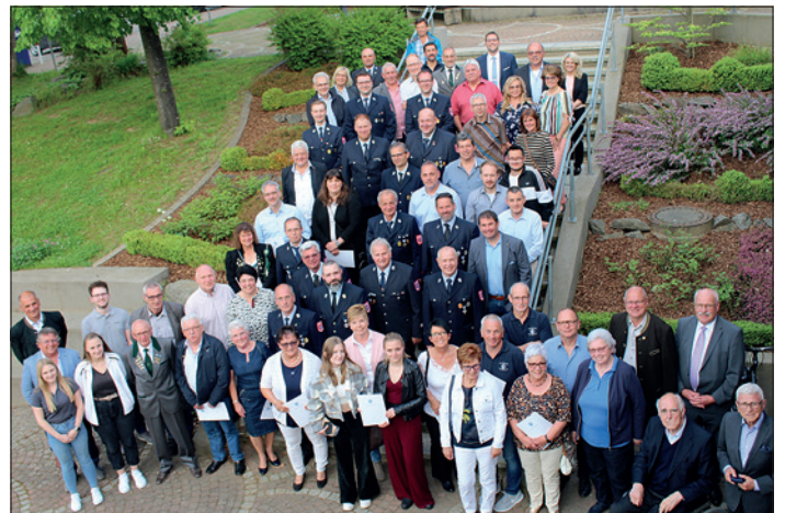
Weitere Bilder auf unserer Homepage unter „Fotoalbum“

Nach zwei Jahren coronabedingter Zwangspause konnte heuer endlich wieder unsere Ehrungsveranstaltung, der „Bessenbacher Frühling“, stattfinden: Am 8. Mai wurden daher nicht nur die Mütter geehrt, sondern bei frühlingshaften Temperaturen – der Name war hier tatsächlich Programm - Mannschaften und Einzelpersonen aus Bessenbach für ihre erbrachten großartigen Leistungen im sportlichen, kulturellen und sozialen Bereich.