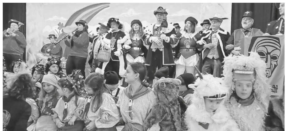
Fröhliche Stimmung auf der Bühne mit der Hürusmusik und Hürus Guisi vo de Hürusmusik mit Gefolge.