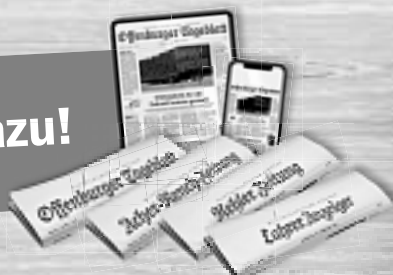
Foto: reiflinterstock.de / Marka777, Osternest: © B. and E. Dudzinsky

☎ 07 81 / 504-55 55 ✉ leserservice@reiff.de ↗ www.mittelbadische.de/ostern2020