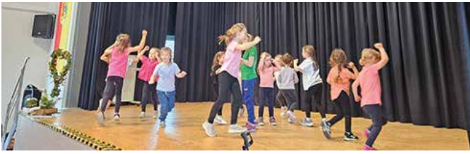
Bild-Impressionen von der Seniorenfeier 2026