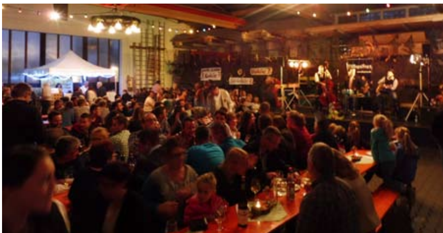
So gemütlich wird's am 19. Oktober beim Weinfest des SV Bunker.

Am 20. und 21. September stehen gleich zwei Termine unserer Freiwilligen Feuerwehr an. Am Freitag, den 20. September , findet die Lange Nacht der Feuerwehr statt. Am Samstag, den 21. September , finden die Patenbitten der Floriansjünger aus unserer Nachbargemeinde Kühenthal am Feuerwehrhaus statt.