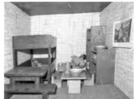
Das Kinderzimmer im Puppenhaus

Gerne besprechen wir alles mit Ihnen auch an unserem nächsten Öffnungstag, am Sonntag, 20. September 2015, an dem wir für Sie wieder von 14.00 Uhr bis 17.00 Uhr da sein werden.