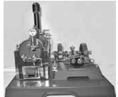
"Dat is ne Dampfmaschin" (Feuerzangenbowle)

Wir denken dabei an die Puppenstube, das Puppenhaus, den Kaufladen, die Eisenbahn und die Dampfmaschine, also die Dinge, mit denen man sich im Haus beschäftigen konnte und manchen trüben Wintertag "spielend" überstanden hat.