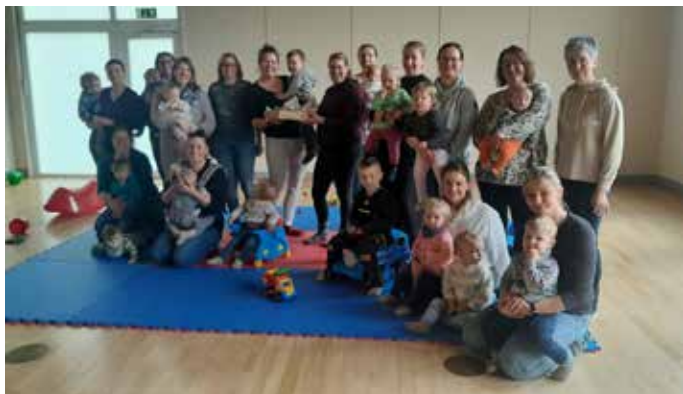
Alles hat ein Ende...