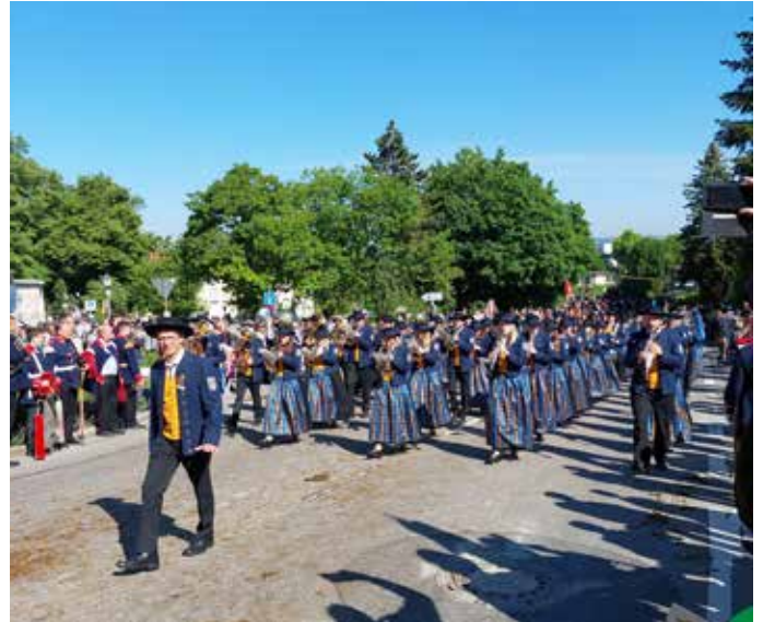
Blutfreitag in Weingarten.

reits ein Fahnenbanner unserer Blutfreitergruppe aus Kirchbierlingen sowie eines der Blutfreitagsgemeinschaft aus Weingarten erhalten. Diese werden wir zukünftig immer an unserer Fahne mittragen.