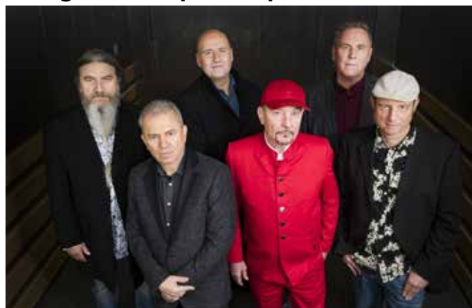
STATUS QUO, Ben Zucker und die Spider Murphy Gang gastieren in Ehingen.

Mit Ben Zucker und den Weltstars STATUS QUO wird der Ehinger Marktplatz diesen Sommer zur Bühne für zwei großartige Konzertabende. „Das ganze Jahr hindurch wird der Ehinger Marktplatz zur Bühne für Begegnung und gemeinschaftliches Miteinander. In diesem Jahr reiht sich mit dem Marktplatz Open Air ein Ereignis in den Veranstaltungskalender der Stadt ein, das neben dem Musiksommer ein weiteres musikalisches Highlight darbietet. Mit Musiktiteln ausgedrückt: Was für eine geile Zeit, wenn sich die bayerische Band nicht auf den Weg nach Minga sondern nach Ehgna macht und rockin´all over the world auf dem Ehinger Markt-