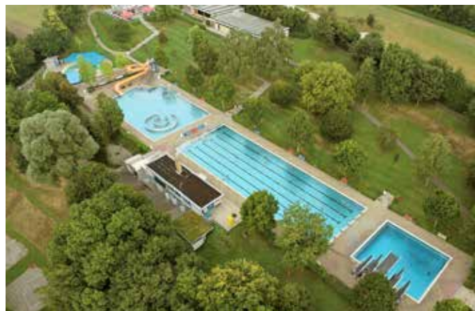
Badespaß im Ehinger Freibad.

Einzelintritte können bar an der Freibadkasse entrichtet werden. Saison- und Zwölferkarten müssen online erworben werden. Noch vorhandene Zwölferkarten können weiterverwendet werden. Infos zu Tickets gibt es auf der Homepage unter freibad.ehingen.de . Geöffnet hat das Freibad täglich von 8 bis 20 Uhr. Die Schwimmhallen Rißtissen, Erbsetten und Wenzelstein bleiben geschlossen.