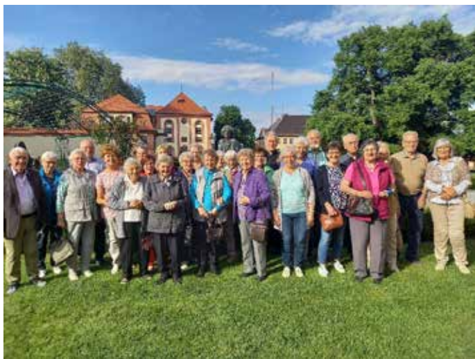
Teilnehmerinnen und Teilnehmer des Halbtagesausflugs.