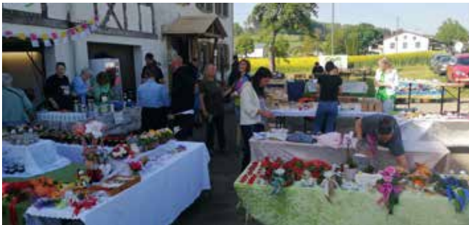
Markttreiben am Gemüsehof Betz.

Im Namen der Ortsverwaltung und der ganzen Familie Betz möchten wir uns für das entgegengebrachte Vertrauen und vor allem für die tolle Bewirtung durch die Feuerwehr und den Landfrauen herzlich bedanken.