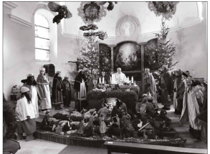
Bilder: Hildegard Stöcker