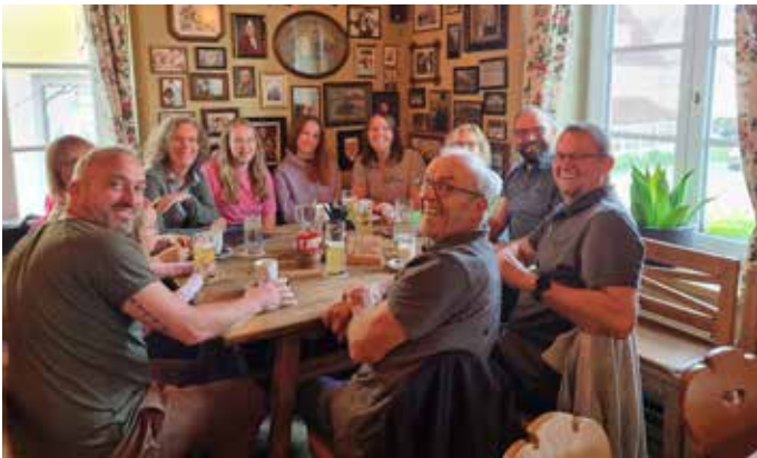
Gute Laune bei den Teilnehmern vom Familienausflug.