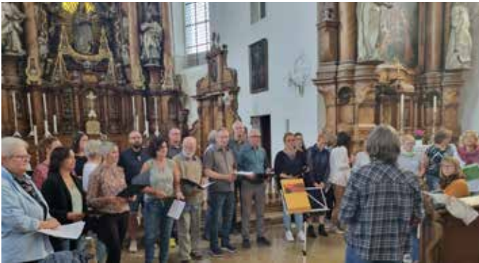
fEinklang bei der Lucia Andacht der Frauenselbsthilfe Gruppe Krebs.