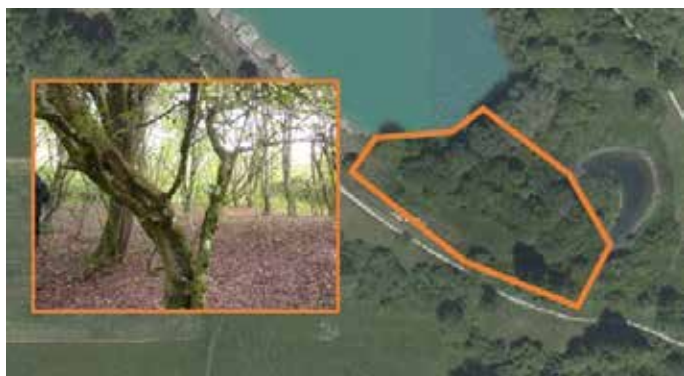
Naturschutzgebiet Blauer Steinbruch.

Über eine Regelpflege in Form einer Mahd oder Beweidung wird der Bereich offengehalten. Seltene Artvorkommen, die sich im Blauen Steinbruch angesiedelt haben, sollen hierdurch gestärkt werden. Neben dieser Habitaterweiterung sind weitere Maßnahmen in Planung, die den Lebensraum für seltene Pflanzen und Tiere im Steinbruch aufwerten. Finanziert werden die Maßnahmen über die Landschaftspflegerichtlinie, über die Pflegemaßnahmen im Sinne des Arten- und Biotopschutzes beauftragt werden können. Kontakt, Landschaftserhaltungsverband Alb-Donau-Kreis e.V., Lydia Steffan, Telefon 0731 1851680.