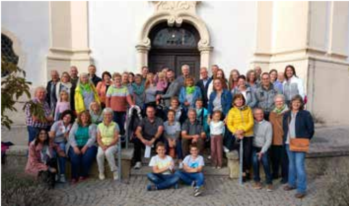
fEinklang beim Familienausflug in Steinhausen.