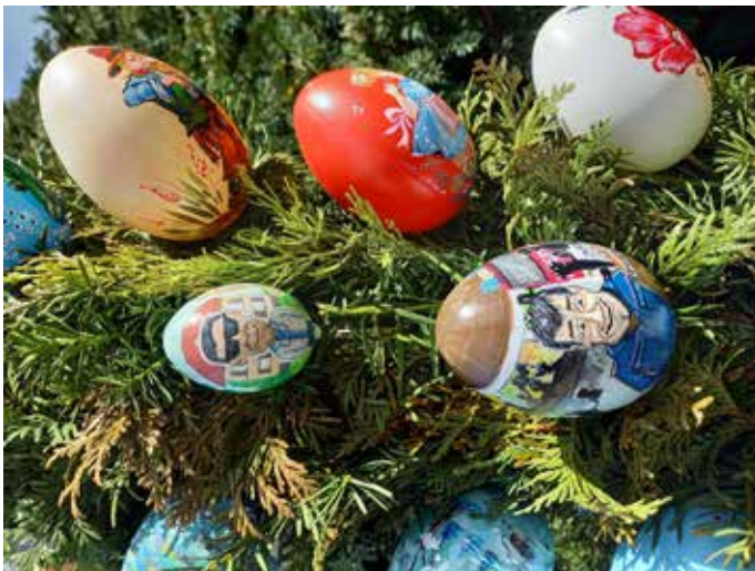
Bunt bemalte Ostereier.