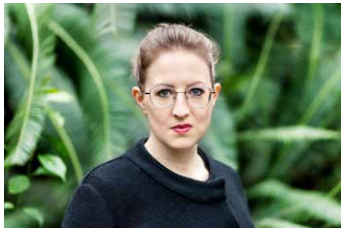
© Studio Tese honorarfreie Nutzung für Cover, Werbung, Presse, Internet (nicht für Lizenzungsbüro) Der Copyright vom Autor/Verleger sowie dem Abdruck oder das Erstellen auf Webseiten ist ausschließlich für Presseverleiher und weitere Maßnahmen geschützt. Die im überlappenden Zusammenhang mit einem bei Druckmaschinen Werk der Autoren werden. Die vom Bild angelegte Copyright-Information ist zu entfernen.

Weitere Informationen unter der Telefonnummer 07391 503-560 oder per E-Mail unter stadtbuecherei@ehingen.de .