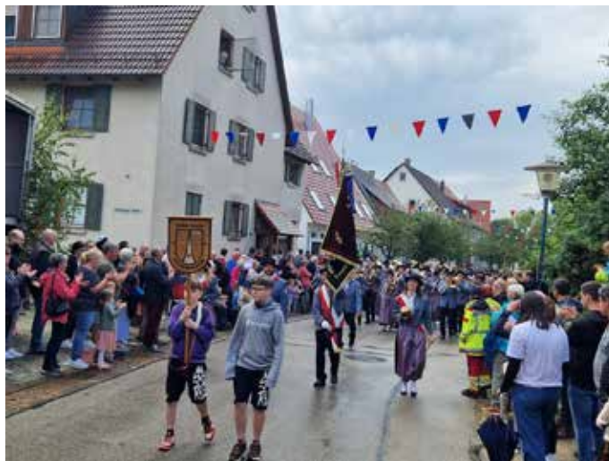
Festumzug Kreismusikfest Seißen.