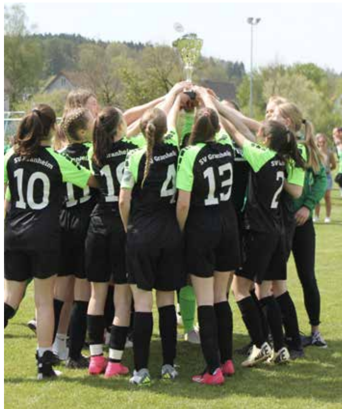
Werde Teil einer tollen Mannschaft und kicke mit anderen Mädchen zusammen beim SV Granheim.

Auf Euer Erscheinen freut sich der SV Granheim.