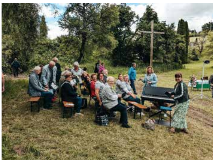
Vorbereitung beim Chor fEinklang.