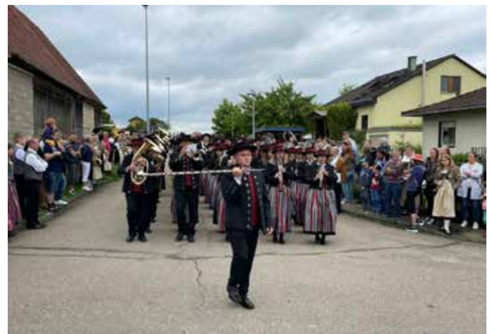
Musikkapelle Kirchen bei der Marschmusikbewertung.

Nach der Rückkehr in Kirchen ging es noch mit Musik durchs Dorf bevor man im Probelokal den Abend ausklingen ließ.