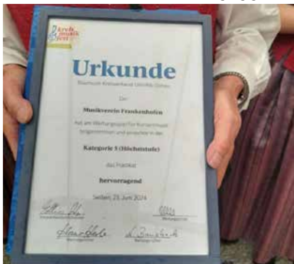
Urkunde für die Teilnahme.

Hervorragend mit 92,2 hieß es dann endlich für den Musikverein Frankenhofen. Dies wurde dann ausgiebig gefeiert.