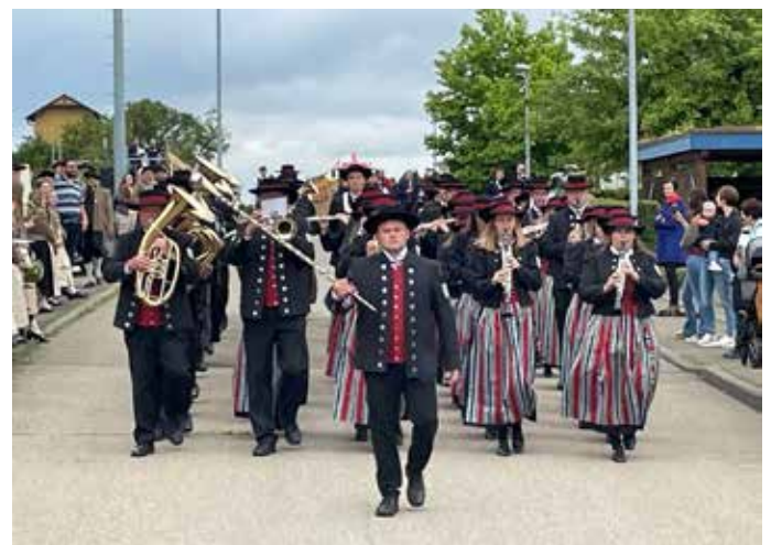
Musikkapelle Kirchen bei der Marschmusikbewertung.