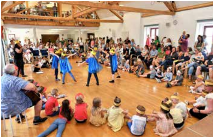
Der Musikschultag wird erneut mit einer Aufführung der Musikalischen Früherziehung eröffnet.

Am Samstag, 29. Juni, findet von 14 Uhr bis 17 Uhr der Musikschultag der Musikschule der Stadt Ehingen statt.