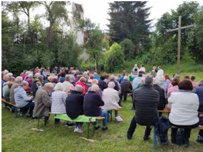
Ökumenischen Gottesdienst in Kirchen mit dem Chor fEinklang.