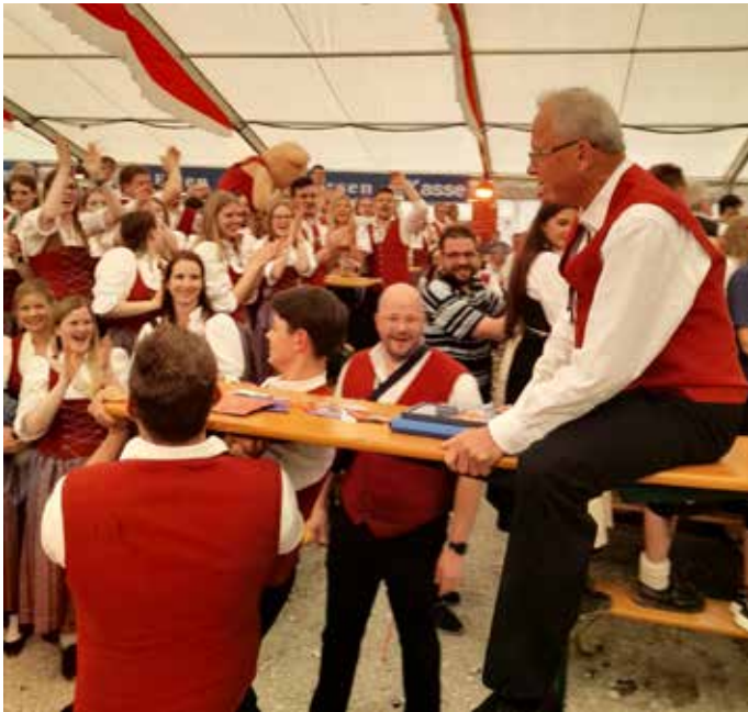
Riesengroßer Jubel bei der Notenbekanntgabe.