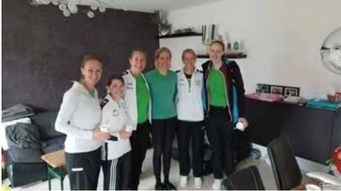
Heimspiel gegen Munderkingen.

Immerhin zwei von sechs Einzeln konnten die Damen am vergangenen Sonntag beim Heimspiel gegen Munderkingen für sich verbuchen zum 2:7 Endstand.