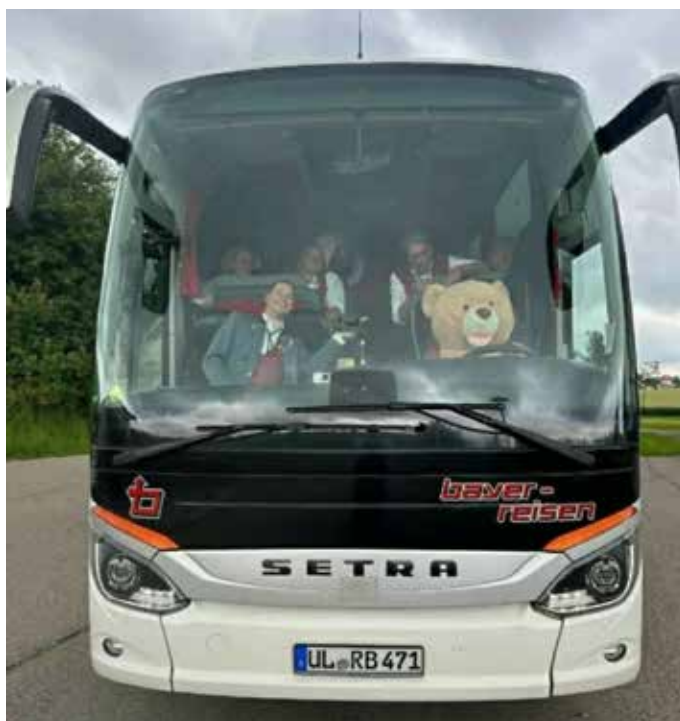
Das Maskottchen Bruno darf auf keinen Fall fehlen.