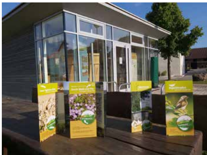
Das Informationszentrum Ehinger Alb ist ab Ostermontag, 1. April, von 10 Uhr bis 16.30 Uhr geöffnet.