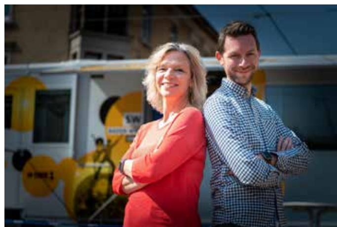
Am 3. April sendet der SWR1 vom Ehinger Marktplatz.

Seit drei Jahren sind Anhalt und Tondera-Klein während der SWR1 Hitparade im Oktober mit dem mobilen Studio im Land unterwegs.