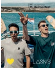
LASNIS: Internationale Festivalstimmung