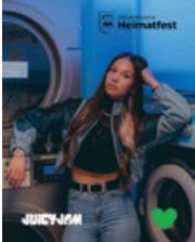
JUCYJAM: Oldschool-Vibes, HipHop und feinsten Deutschrap

Ab 20:00 Uhr DJ-Partynacht im Festzelt Mittelbiberach