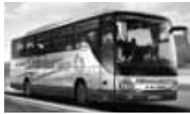
Leib und Seele auf Reisen