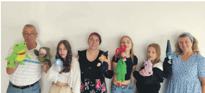
Spannendes Kasperltheater beim Team des Kath. Kirchenchores